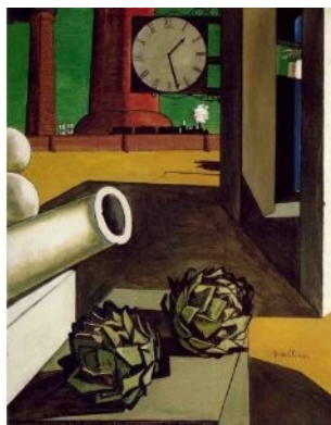
ΕΙΚΟΝΕΣ: G. de Chirico, Μεταφυσικό εσωτερικό με μπισκότα (1917) και Η κατάκτηση του φιλοσόφου (1914)